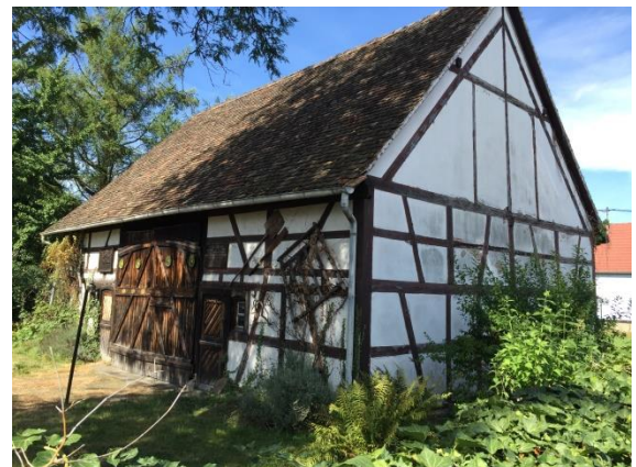
sog. „Goethe-Scheune“ in Sessenheim